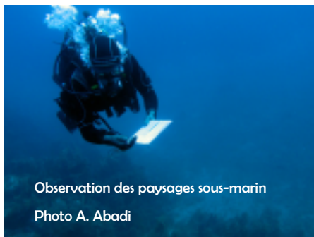
Observation des paysages sous-marin

- Les pêcheurs sentinelles du milieu marin à destination des pêcheurs de loisir et professionnels www.ecorem.fr/pecheurs-sentinelles .