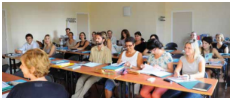
Journées d'échanges " acteurs EEDD et éducateurs santé " - 10 et 11 septembre 2012

- Les espaces d'échanges de pratiques, par l'organisation de journées d'échanges et de groupes de travail.