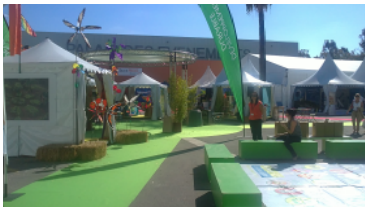
Les stands du village développement durable