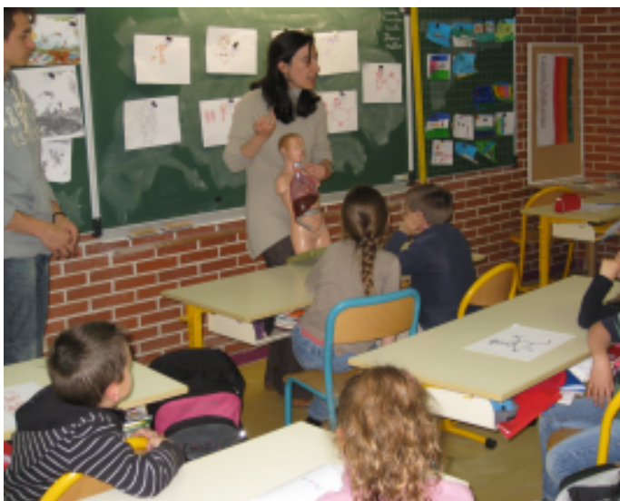
Intervention en classe dans le cadre des campagnes Santé environnement coordonnées par le GRAINE PACA

La santé est un état influencé par de nombreux déterminants : socio-économiques, culturels et environnementaux. L'environnement est alors appréhendé comme le milieu dans lequel vivent les individus, il évoque des lieux et des conditions de vie. Ce lien est clairement établi en 1989 dans la Charte européenne de l'environnement et de la santé : «Bonne santé et bien-être exigent un environnement propre et harmonieux dans lequel tous les facteurs physiques, psychologiques, sociaux et esthétiques reçoivent leur juste place. Un tel environnement devrait être traité comme une ressource en vue de l'amélioration des conditions de vie et de bien-être». La promotion de la santé intègre donc les enjeux environnementaux.