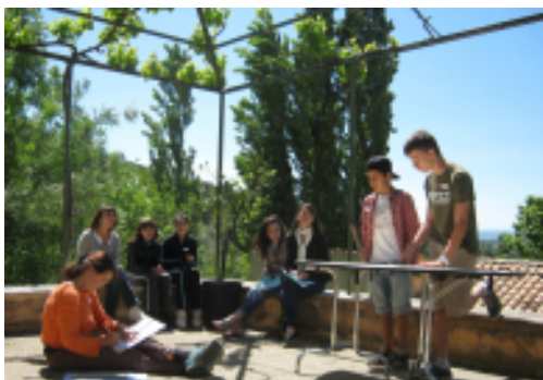
Bilan de l'Agenda 21 avec les collèves

Les collèges du Verdon (Castellane), Maria Borelly (Digne les Bains), Paul Arène (Sisteron), Jean Giono (Manosque), André Ailhaud (Volx), Pays de Banon (Banon), Marcel Massot (La Motte du Caire) et l'Ecole Internationale Provence-Alpes-Côte d'Azur (Manosque). Ces derniers bénéficient durant 2 ans des accompagnements méthodologique et pédagogique apportés par le CPIE Alpes de Provence. A l'heure actuelle, la plupart des établissements ont construit un programme d'actions et plusieurs projets commencent à voir le jour comme la création de potagers, la mise en place du tri et de la collecte du papier, la fabrication de nichoirs, la conception de menus à base de produits locaux, l'organisation d'ateliers créatifs (papier recyclé notamment) ou de sorties et visites pédagogiques.