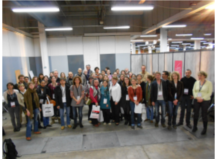
Assises nationales de l'EEDD 2013 - Atelier "rebond des territoires" PACA.

Plus d'informations sur www.assises-eedd.org Pour consulter le compte-rendu des rebonds en territoire, contactez le GRAINE PACA : gpaca@grainepaca.org