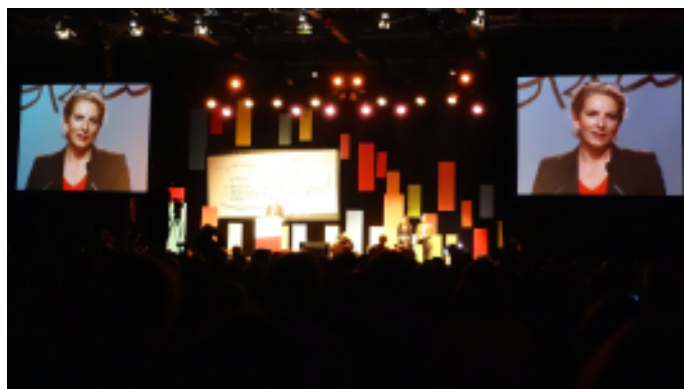
Discours de Delphine Batho, ministre de l'Ecologie, lors des 3èmes Assises nationales de l'EEDD, le 5 mars 2013 à Lyon.

"Nous étions 1200 participants, dont environ 80 venant de PACA, 95 assises territoriales avaient préparé ces rencontres. Le discours de la ministre de l'écologie était encourageant. L'EEDD sera intégrée dans la Conférence environnementale de septembre. Ainsi il paraît évident qu'il ne peut pas y avoir de transition écologique, sans participation citoyenne et que celle-ci nécessite une éducation. L'EEDD apparaît incontournable pour répondre positivement à la crise écologique, économique et sociale. 48 propositions, issues du travail en ateliers, tracent une feuille de route, 11 priorités ont été choisies par les participants. On peut regretter, qu'à force de synthèses, elles soient un peu trop édulcorées. N'hésitez pas à lire et à mettre en œuvre ces propositions, qui seront accessibles, plus argumentées sur le site internet. J'ai à nouveau constaté qu'il y avait des personnes très motivées et compétentes qui agissent durablement, dans les territoires, à tous les niveaux. Le forum des outils était particulièrement riche, diversifié et innovant.