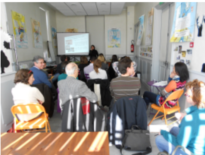
Journée d'échanges "EEDD et grand public" à l'Atelier Méditerranéen de l'Environnement, Marseille (13) - 14 mars 2013.

L'objectif d'éduquer le « grand public » impulsé par les pouvoirs publics se heurte à cette réalité, comme le démontre l'action des Espaces Info Energie (voir témoignage p.10).