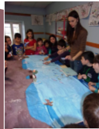
Fresque représentant les différents milieux des salins, animée par la LPO PACA