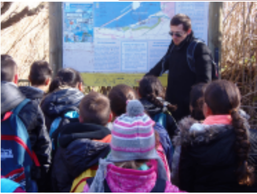
Sortie autour de l'étang de Berre pour la découverte des zones humides avec les enfants du chalet