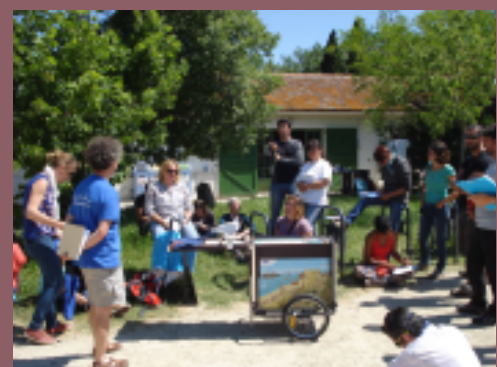
Journée de formation des animateurs et gestionnaires