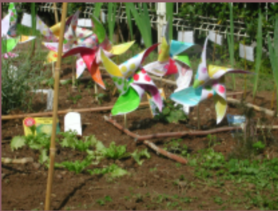
Jardin potager en école maternelle

Etre à l'extérieur, renouer un lien avec la nature, réapprendre comment pousse et évolue une graine sont les atouts fondamentaux d'un potager à l'école. De la maternelle au lycée, le potager peut être une source intarissable d'apprentissage et de partage. Les expériences sont multiples : travailler et enrichir la terre,