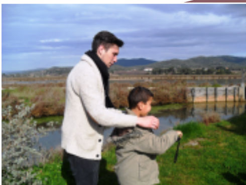
Rallye photos animés par les animateurs dans les Salins d'Hyères