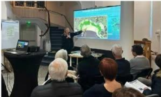
La responsable du service mer a précisé la réglementation autour de l'ancrage des navires dans la baie de La Ciotat.