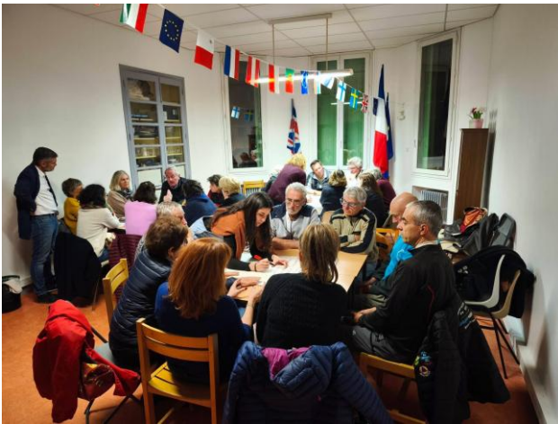
Jeudi de l'Observatoire 20/11/25 Préservons les espèces du bâti

Les propositions émanant de ce processus de dialogue territorial sont une base précieuse pour éclairer et faciliter la décision locale